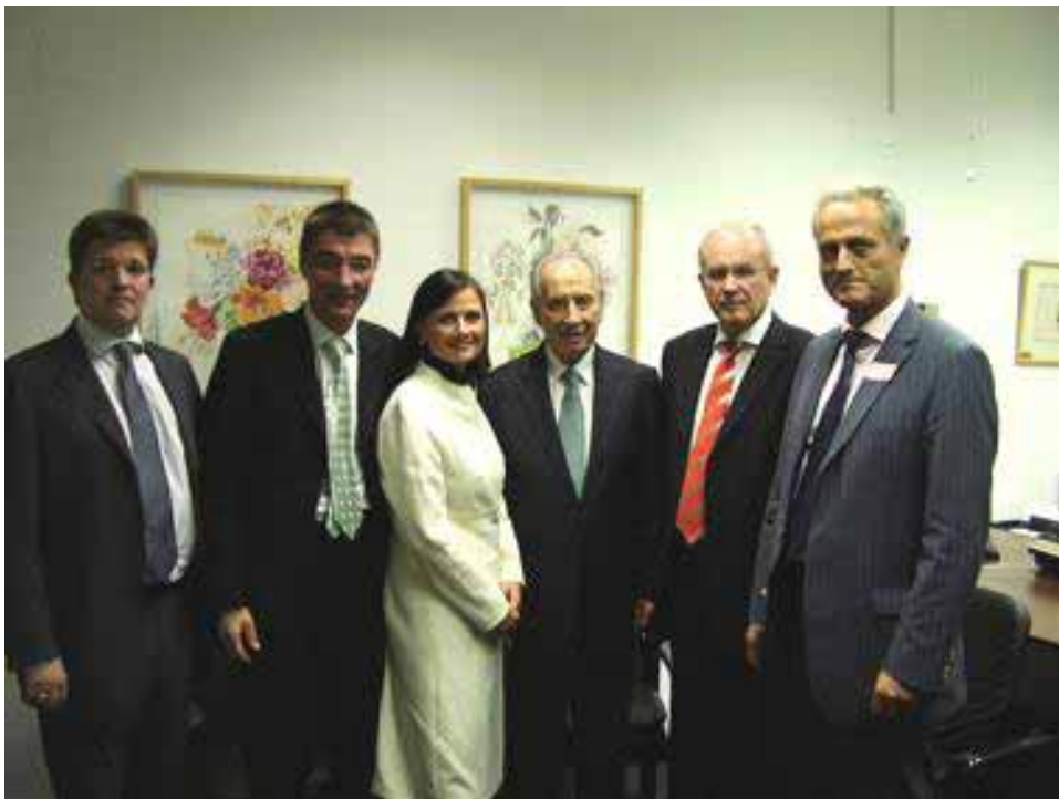
Die deutsche Delegation mit dem ehemaligen Ministerpräsidenten und Friedensnobelpreisträger Shimon Peres. (v. l. Eckart von Klaeden, Andreas Schockenhoff, Gitta Connemann, Shimon Peres, Volker Kauder und Peter Ramsauer)

Die Delegation machte deutlich, dass aufgrund der historischen-moralischen Verantwortung Deutschlands für die Schoah das Existenzrecht des Staates Israel immer unverrückbare Grundposition deutscher Politik bleiben müsse. Deutschlands Verbundenheit mit Israel beruhe aber nicht nur auf der empfundenen historischen Verantwortung. Israel und Deutschland sind verbunden durch eine gemeinsame jüdisch-christliche Tradition und eine gemeinsame Wertebasis. Die Werte der freien Welt sind das Fundament der deutsch-israelischen Beziehungen.