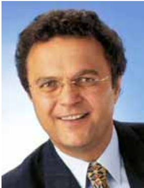
Hans-Peter Friedrich stellvertretender Fraktionsvor- sitzender

Der Fahrplan für die Kapitalprivatisierung der Deutschen Bahn AG steht. Die Fachpolitiker der Koalitionsfraktionen und der Bundesverkehrsminister haben sich auf die Eckpunkte und einen entsprechenden Antragsentwurf geeinigt. Auf dieser Basis kann die Bundesregierung bis Ende März 2007 ein Privatisierungsgesetz erarbeiten.