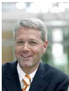
Norbert Röttgen Erster Parlamentarischer Geschäftsführer

Nach langem Ringen um ein Privatisierungskonzept fährt die Bahn nun in eine gute Zukunft. Die Unionsfraktion hat den in der Koalition vereinbarten Eckpunkten für eine Teilprivatisierung der Bahn zugestimmt. Auf dieser Basis kann bis Ende März 2007 ein Privatisierungsgesetz erar-