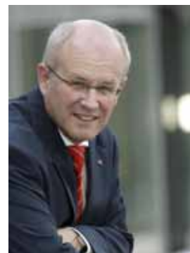
Volker Kauder Vorsitzender der CDU/CSU- Bundestagsfraktion

In der vergangenen Woche haben wir uns zudem auf eine Reform der Unternehmensteuer verständigt, die am 1. Januar 2008 in Kraft treten wird. Wir senken die steuerlichen Belastungen für alle Unternehmen – Mittelstand und große Kapitalgesellschaften – auf ein international wettbewerbsfähiges Niveau von unter 30 Prozent. Ein wichtiger Erfolg aus Sicht der CDU/CSU-Bundestagsfraktion ist zudem die Tatsache, dass das Problem der Gewinnverlagerung ins Ausland nicht mit Maßnahmen bekämpft wird, die zu einer erheblichen Besteuerung der unternehmerischen Substanz geführt hätten. Die vereinbarten Beschlüsse zur Gegenfinanzierung erlauben eine Nettoentlastung von rund 5 Milliarden Euro und stellen damit sicher, dass das Ziel der Haushaltskonsolidierung nicht in Frage gestellt wird. Mit der Senkung der Unternehmensteuern setzt die Union ein wichtiges Anliegen der deutschen Wirtschaft um und schafft eine weitere Voraussetzung für unser zentrales Ziel: Mehr Wachstum und Beschäftigung.