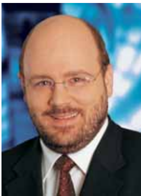
Steffen Kampeter Vorsitzender der Arbeitsgruppe Haushalt

Die unionsgeführte Koalition setzt die Haushaltskonsolidierung erfolgreich fort. Wir senken die Nettokreditaufnahme 2007 auf 19,6 Mrd. € Das sind 2,4 Mrd. € weniger als im Entwurf der Bundesregierung. Damit haben wir die niedrigste Neuverschuldung seit der Deutschen Wiedervereinigung 1990 erreicht. Wir halten seit vielen Jahren erstmals wieder die Regelgrenze des Artikels 115 ein, wonach die Neuverschuldung